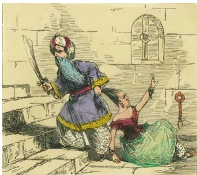
Barbe bleue , illustration de l'anglais Edmund Evans, vers 1888.

La réussite de Perrault est indéniable: La Barbe Bleue est un conte dont le succès ne se dément pas, comme en témoignent de nombreuses adaptations, musicales avec l'opéra-bouffe Barbe Bleue d'Offenbach ou Le Château de Barbe Bleue de Bela Bartok, cinématographiques avec le film de Méliès en 1901, ou La Huitième femme de Barbe Bleue d'Ernest Lubitsch, film de 1938. Le théâtre n'est pas en reste avec des récritures très contemporaines : l'auteure allemande Dea Loher a écrit Barbe Bleue, espoir des femmes en 1998, tandis que La petite pièce en haut de l'escalier de Carole Fréchette, écrivaine canadienne, a été publiée en 2008.